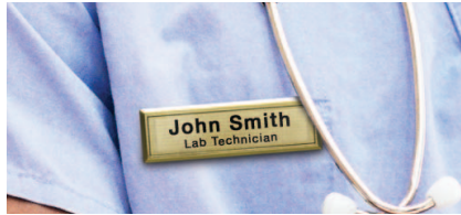
ฉลากสำหรับภาพลักษณ์ที่เป็นมืออาชีพ