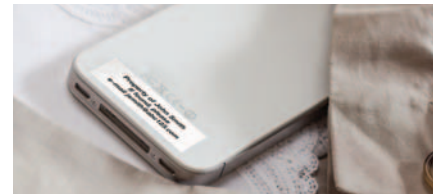
ฉลากสำหรับดูแลรักษาทรัพย์สิน